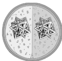
Fondazione per la Promozione della Cultura Professionale e dello Sviluppo Economico

La "Fondazione per la promozione della cultura professionale e dello sviluppo economico" è stata costituita il 9 ottobre 1996 e non ha fini di lucro. Gli scopi della Fondazione riguardano l'attuazione di iniziative del più alto interesse culturale per la promozione e la valorizzazione dell'attività professionale, il suo costante aggiornamento tecnico-scientifico e culturale, la promozione e l'attuazione di ogni iniziativa diretta alla formazione degli aspiranti Dottori Commercialisti.